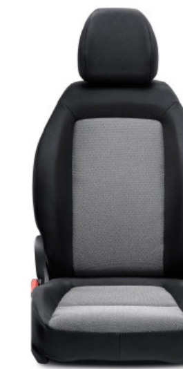
SE MT SPORT AUTOMÁTICO